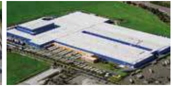
Hörmann KG Ichtershausen, Deutschland