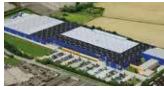
Hörmann KG Brandis, Deutschland