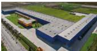
Hörmann Tianjin, China