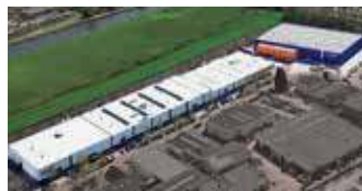
Hörmann Alkmaar B.V., Niederlande