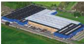
Hörmann KG Werne, Deutschland