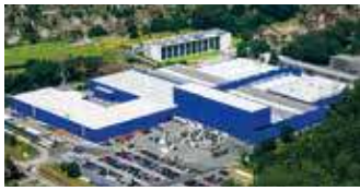
Hörmann KG Amshausen, Deutschland