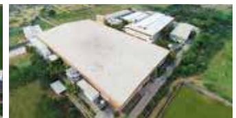
Shakti Hörmann Pvt. Ltd., Indien

Als einziger Hersteller auf dem internationalen Markt bietet die Hörmann Gruppe alle wichtigen Bauelemente aus einer Hand. Sie werden in hochspezialisierten Werken nach dem neuesten Stand der Technik gefertigt. Durch das flächendeckende Vertriebs- und Servicenetz in Europa und die Präsenz in Amerika und Asien ist Hörmann Ihr starker, internationaler Partner für hochwertige Bauelemente. In einer Qualität ohne Kompromisse.