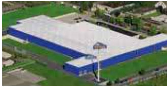
Hörmann KG Dissen, Deutschland