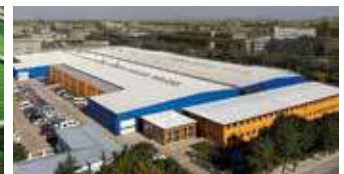
Hörmann Beijing, China