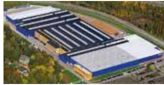
Hörmann KG Eckelhausen, Deutschland