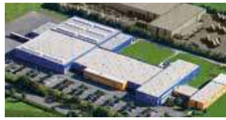
Hörmann KG Antriebstechnik, Deutschland