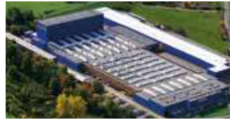
Hörmann KG Freisen, Deutschland