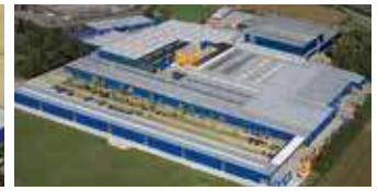
Hörmann KG Brockhagen, Deutschland