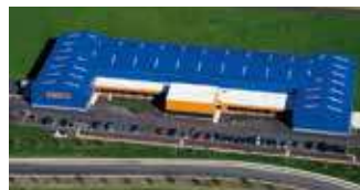
Hörmann Flexon LLC, Burgettstown PA, USA